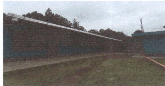
Foto 4: CANALES Y BAJADAS DE AGUA PLUVIAL. Sustitución de canal de pvc por canaletas de alto caudal con bases de metal soldadas.