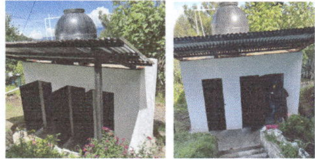
Foto 2: Sustitución de 3 puertas de metal en servicios sanitarios.