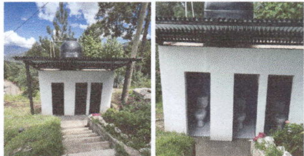
Foto 6: SERVICIOS SANITARIOS , se realizo una remodelación completa de los servicios sanitarios, sustitución de inodoros, sustitucion de puertas, cambio de direccion, colocación de techo colocacion de azulejo,ceramica

Observación: Si es necesario se pueden agregar hojas adicionales. Máximo número de hojas.