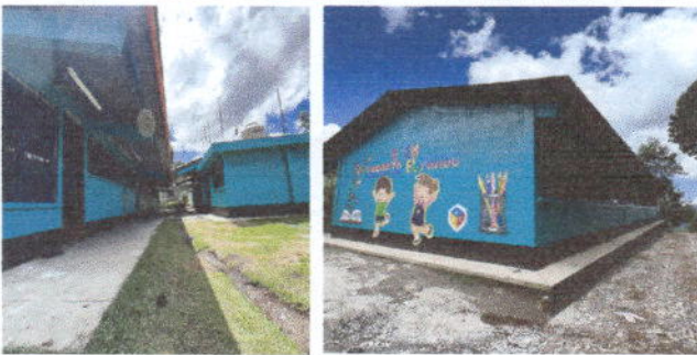
Foto 5: PINTURA EN MUROS EXTERIORES E INTERIORES. Logrando una presentación renovada, nueva, mejorando el ambiente y confort del interior y exterior del centro educativo.